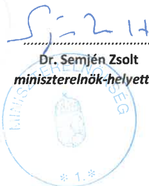
Dr. Semjén Zsolt miniszterelnök-helyettes