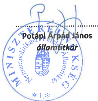
Potápi Árpád János államtitkár

A Bizottság felhívja a Bethlen Gábor Alapkezelő Zrt.-t, hogy a jelen határozatban foglaltak végrehajtása érdekében a szükséges intézkedéseket tegye meg.